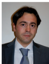
Nuovi sistemi nel costruire. Il pavimento flottante in ceramica Luca Mastroiacovo Cooperativa Ceramica d'Imola